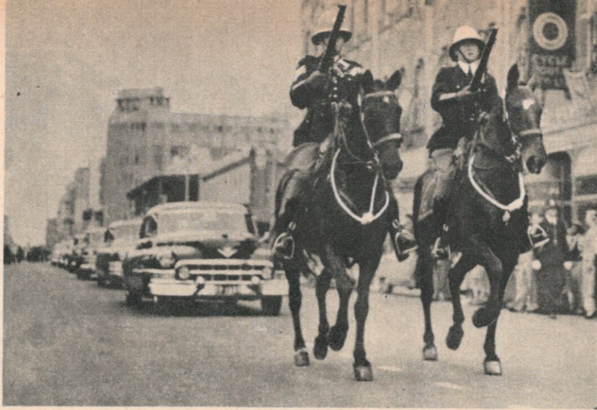
Tydens die besoek van S.K.H. Prins Bernhard van die Nederlande het 'n indrukwekkende stoet deur Kerkstraat, Pretoria, beweeg